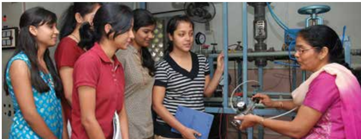
Politechnika dla kobiet firmy Cummins w Indiach służy grupie o mniejszościowym udziale w segmencie inżynierii.

Pyt. Jak mogę zaangażować się w działania na rzecz społeczności w firmie Cummins?