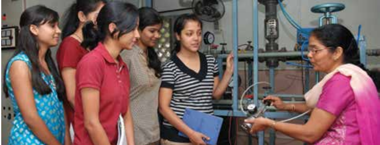
La facultad de ingeniería para mujeres de Cummins en India atiende a un sector demográfico infrarrepresentado en el campo de la ingeniería.

P ¿Cómo puedo participar en actividades comunitarias en Cummins?