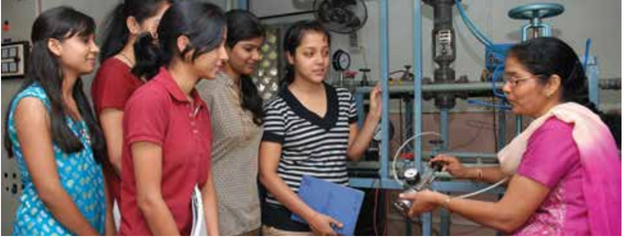
Hindistan'daki Kadınlar için Cummins Mühendislik Yüksekokulu, mühendislik alanında yetersiz temsil edilen bir demografik kesime hizmet eder.

S Cummins'in topluluk faaliyetlerine nasıl dahil olabilirim?